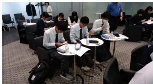
企業での研修(左: Cisco 、 右: 日本アイ・ビー・エム)