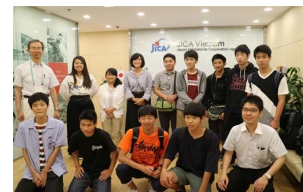
ベトナムスタディーツアー(左:キムリエン高校生徒との交流 、 右:JICAベトナムにて)