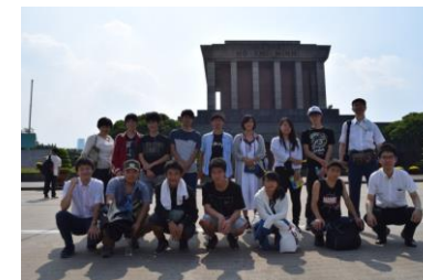
ベトナムスタディーツアー(左3枚 : NTTデータベトナムの現地スタッフとフィールドワーク・プレゼン準備・発表 、 右1枚 : ハノイ市内見学)